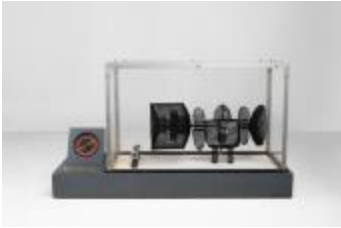
Thruco (I2-A) (CO_0037_1966)