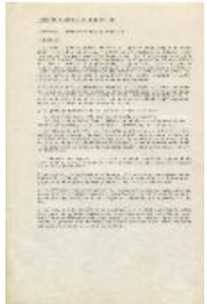
Instituto de Artes Visuales de Santiago. Programa (3-10001)