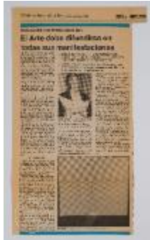
El Arte debe difundirse en todas sus manifestaciones (5-10006)