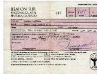
Comprobante del artista (6-30003)