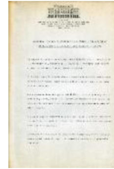
Bases para Concurso de escenografía y/o vestuario para las operas "Andrea Chenier" de Giordano y "La Cenicienta" de Rossini (1-10012)