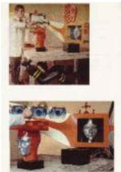
Carlos Ortúzar en su taller (6-10001)