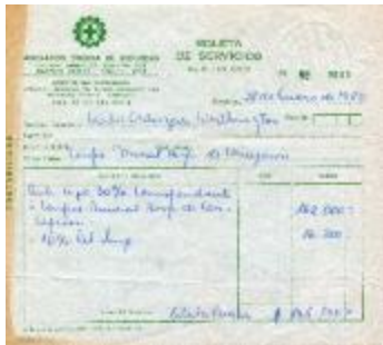
Boleta de servicios (6-30005)