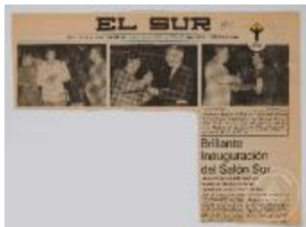
Brillante inauguración del Salón Sur (5-10002)