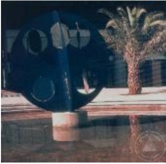
Vista frontal de la escultura pública El Cuarto Mundo (6-10013)