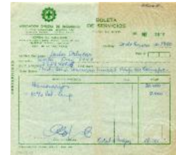
Boleta de servicios (6-30004)