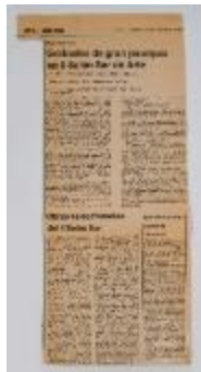
Grabados de gran jerarquía en el II Salón Sur de Arte (5-10010)