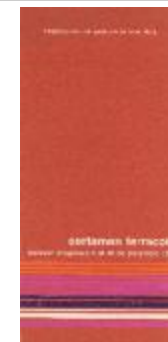
Exposición de pintura al aire libre. Certamen Terracota (5-20010)