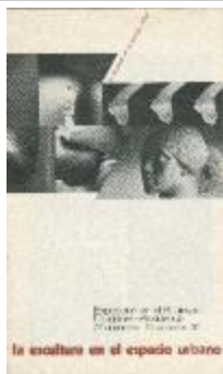
La escultura en el espacio urbano (5-20012)