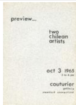
preview... two chilean artist (5-20004)