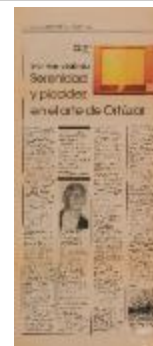
Serenidad y placidez en el arte de Ortúzar. Gran premio Salón Sur (5-10004)