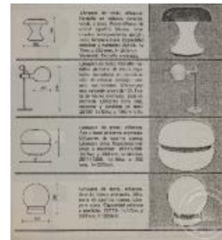
Recorte de folleto de lamparas de diseño (4-20004)