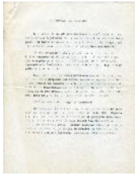
Tejenderas de Putaendo (1-10010)