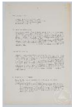
Taller de volumen. Programa (3-10007)