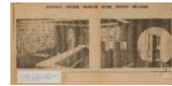
Recorte de prensa de Mural Banco de Concepción (5-10001)