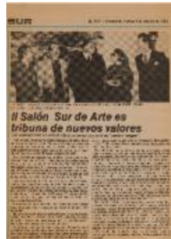
El Salón Sur de Arte es tribuna de nuevos valores (5-10007)