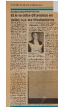
El arte debe difundirse en todas sus manifestaciones (5-10009)