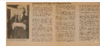
Significado II Salón Sur Nacional de Arte (5-10005)