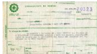
Comprobante de egreso (6-30006)