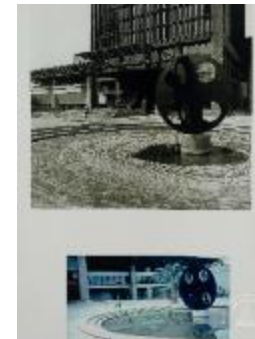
Vistas en 3/4 de la escultura El Cuarto Mundo (6-10012)