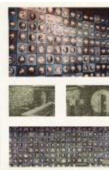
Vistas del mural del Banco de Concepción (6-10010)