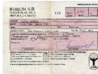
Comprobante del artista (6-30002)