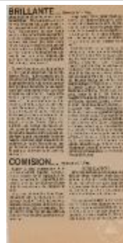
Brillante inauguración del Salón sur (Continuación) (5-10003)