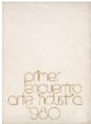
Primer Encuentro Arte-Industria 1980 (5-20011)