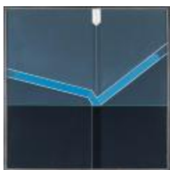
No identificado (CO_0054_1979)