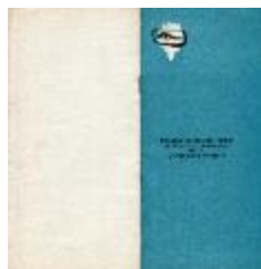
Premio Acero del Pacífico (5-20002)