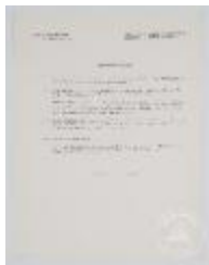
Taller de composición. Ejercicio nº 6 (3-10015)