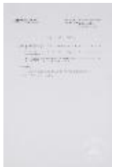
Tema final común (3-10023)