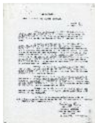
El paisaje. Obras recientes de Carlos Ortúzar (2-10012)