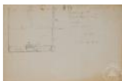
Croquis de pintura 6 (4-30007)