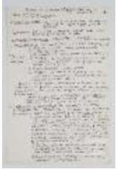
Taller de composición. Borrador de programa flexible adaptable al estudiante (3-10020)