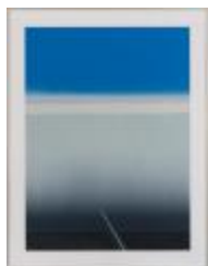
No identificado (CO_0033_1986)