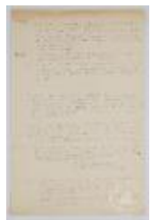
Programa forma color I básico 1973 (3-10006)