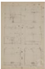
Croquis pinturas 1 (4-30002)