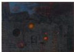
No identificado (CO_0032_1963)