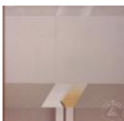
Vista frontal de la Serie Space 26 (6-10029)