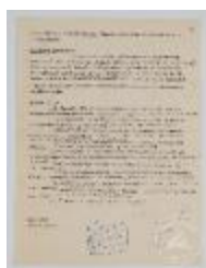
Taller experimentación de Volumen (uso de materiales tradicionales y no tradicionales) (3-10003-3)