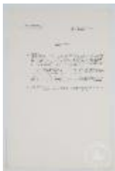
Taller de composición. Ejercicio nº 7 (3-10016)