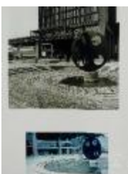
Vistas en 3/4 de la escultura El Cuarto Mundo (6-10012)