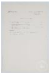
Taller de composición. Tema final común (3-10017)