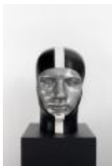
Sr. E (CO_0034_1966)