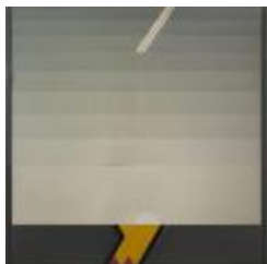
No identificado (CO_0098_1983)