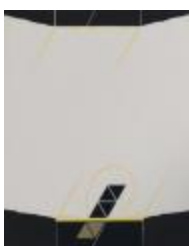
No identificado (CO_0069_1984)