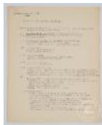
Programa forma y color 1 año básico (3-10003)