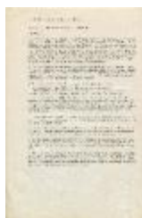
Instituto de Artes Visuales de Santiago. Programa (3-10001)