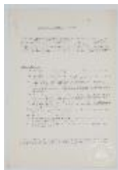
Primer Año. Taller forma-color (3-10002)