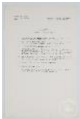
Taller de composición. Ejercicio nº 5. Volumen de transparencia. (3- 10014)