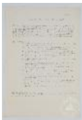
Primer año. Taller volumen (forma-espacio) (3-10003-1)