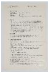
Taller de composición. Escuela de Arquitectura. Universidad Central. 1985 (3-10013)