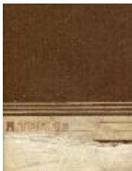
Cuaderno de croquis (4-30001)