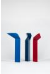
No identificado (CO_0094_1983 –1984)