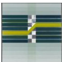
Espacio I (CO_0048_1977)