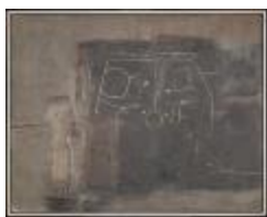
Visión del norte chico (CO_0050_1960)