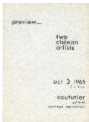
preview... two chilean artist (5-20004)