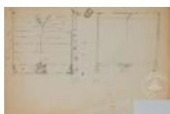
Croquis de pintura 5 (4-30006)