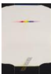
No identificado (CO_0002_1984)