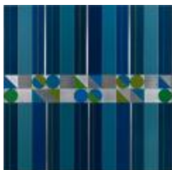
Pintura 51 (CO_0035_1975)