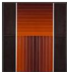
Pintura N° 4 (CO_0053_1976)