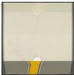
No identificado (CO_0046_1983)