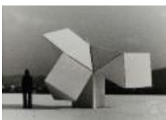
Vista de maqueta en base a prismas triangulares (6-10037)