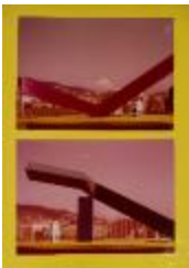
Set de fotografías frontales de maquetas escultóricas de prismas (6-10033)