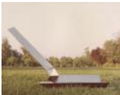
Vista frontal obra "Prismas" (6-10020)