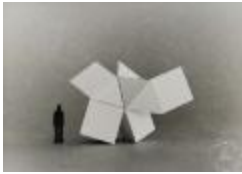
Vista maqueta en base a prisma triangular (6-10039)