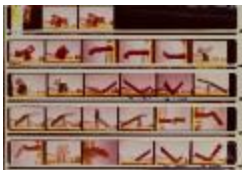
Vistas de maquetas de prismas triangulares (6-10034)