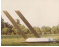
Vista frontal obra "Paralelas" (6-10019)