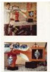
Carlos Ortuzar en su taller (6-10001)