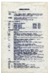
Curriculum Profesional (2-10006)