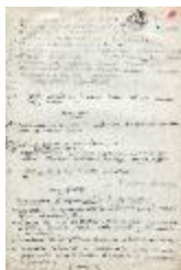
Desarrollo anteproyecto y trabajo final (3-30006)