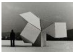
Vista de maqueta en base a prismas triangulares (6-10037)