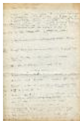
At Work from 3-10-1980 (6-20005)