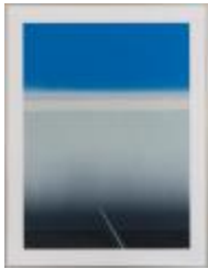
No identificado (CO_0033_1986)