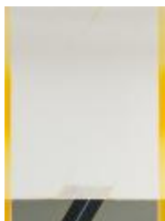
No identificado (CO_0072_1985)