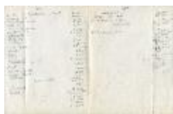
Calculo ingresos y egresos (1-10012)