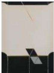
No identificado (CO_0062_1984)