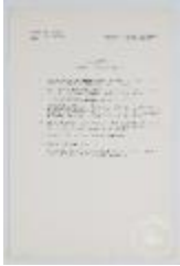
Taller de composición. Ejercicio nº 5. Volumen de transparencia. (3- 10014)