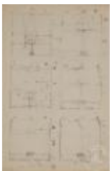
Croquis pinturas 1 (4-30002)