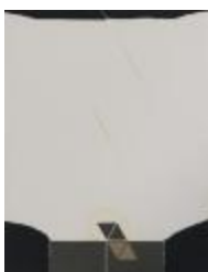
No identificado (CO_0066_1984)