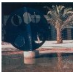
Vista frontal de la escultura publica El Cuarto Mundo (6-10013)