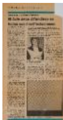
El arte debe difundirse en todas sus manifestaciones (5-10009)