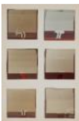
Vista frontal de obras pictóricas de la Serie Space (6-10041)