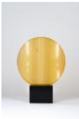
No identificado (CO_0090_1970)