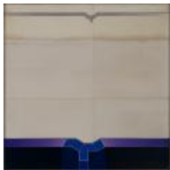
No identificado (CO_0096_1979)