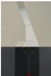
No identificado (CO_0095_1981)