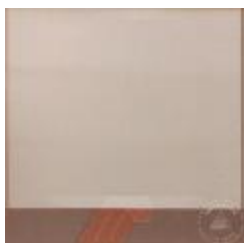
Registro frontal "Space 22" (6-10023)