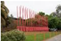
Cintac- multiple sculpture (CO_0120_1981)