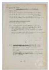
Programa forma y color 1er. año básico común (3-10005)