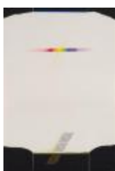
No identificado (CO_0002_1984)