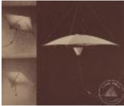
Recorte de folleto de diseño (4-20003)