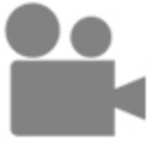
Espigas de fierro al viento (CO_0123_1971)