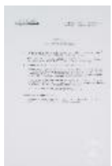
Taller de composición. Ejercicio nº 5 "Volumen de transparencia" (3-10024)