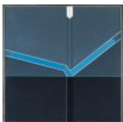
No identificado (CO_0054_1979)