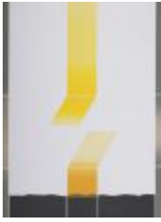
No identificado (CO_0139_sf)