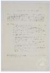
Primer año. Taller volumen (forma-espacio) (3-10003-1)