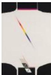
No identificado (CO_0001_1984)