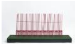
Maqueta CINTAC (CO_0043_1981)