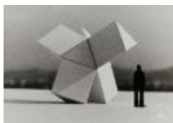
Vista frontal de maqueta basada en prismas triangulares (6-10036)