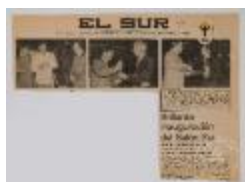
Brillante inauguración del Salón Sur (5-10002)