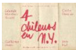
4 chilenos en n.y (5-20001)