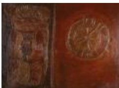
Huentelauquén I (CO_0145_1962)