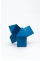
No identificado (CO_0086_1974 –1979)