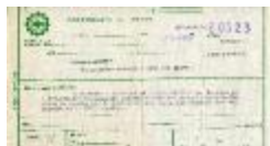
Comprobante de egreso (6-30006)