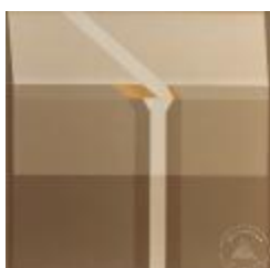
Vista frontal de pintura de la Serie Space (6-10028)