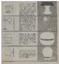
Recorte de folleto de lamparas de diseño (4-20004)