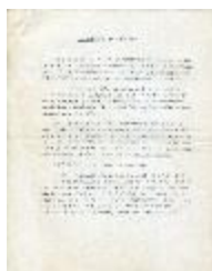
Tejenderas de Putaendo (1-10010)