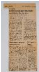
Grabados de gran jerarquía en el II Salón Sur de Arte (5-10010)