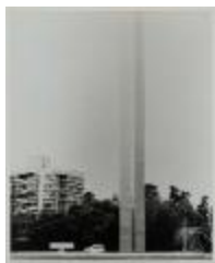
Vista general de la escultura pública Homenaje a Schneider (6-10014)