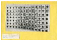
Vista diagonal del Mural línea Aérea Varig. Santiago. 1970. (6-10009)