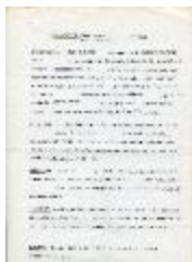
Contrato de arrendamiento de servicios materiales (6-30001)