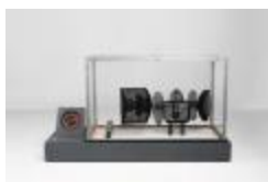
Thrauco (I2-A) (CO_0037_1966)