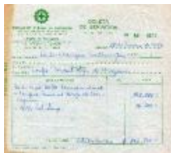
Boleta de servicios (6-30005)