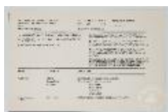
Taller de composición. Carrera de Arquitectura. Universidad Central. 1984 (3-10012)