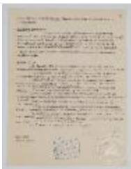
Taller experimentación de Volumen (uso de materiales tradicionales y no tradicionales) (3-10003-3)