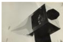
Sr.E en el aparato rotatorio (CO_0136)