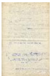
Borrador definitivo de síntesis de carrera (2-10007)