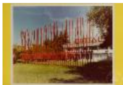
Vista 3/4 de escultura cinética frente a CINTAC (6-10015)