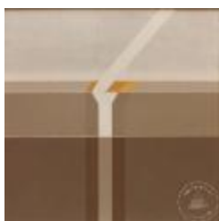
Vista frontal pintura planimétrica (6-10021)