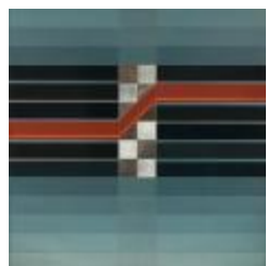
Pintura # 14 (CO_0018_1976)