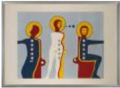
Coloquio de los humanonautas (CO_0009_1967)