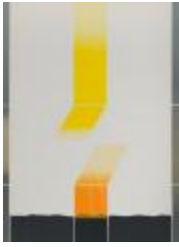
No identificado (CO_0085_1986)