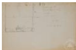
Croquis de pintura 6 (4-30007)