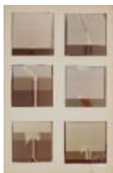
Vista frontal de obras pictóricas de la serie Space (6-10042)