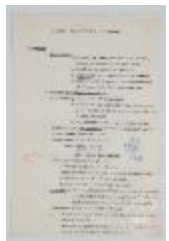
Programa Forma y color 1 año básico (3-10004)