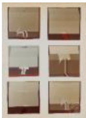
Vista frontal de obras pictóricas de la serie Space (6-10046)