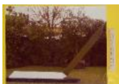
Vista frontal de maqueta escultura "Shell". 1980 (6-10016)