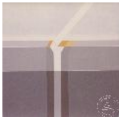
Vista frontal obra Space 13 (6-10025)