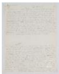
Taller de volumen (3-10010)