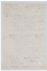
Taller de composición (3-10019)