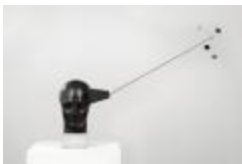
Apolo (CO_0087_1966 –1967)