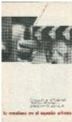
La escultura en el espacio urbano (5-20012)