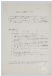
Primer Año. Taller forma-color (3-10002)