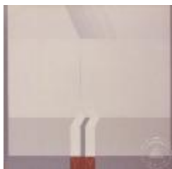
Vista frontal de la obra Space 10 (6-10032)