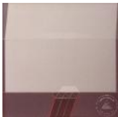
Vista frontal de obra de la Serie Space (6-10024)