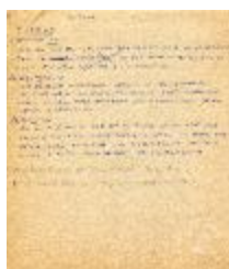
Modulo. Conceptos. Modulo Variable (3-30008)