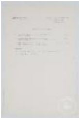
Taller de composición. Tema final común (3-10017)