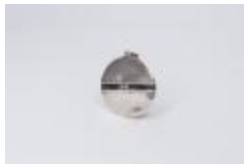
Colgante de plata (CO_0093_1975 –1979)