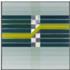
Espacio I (CO_0048_1977)