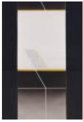
No identificado (CO_0006_1985)