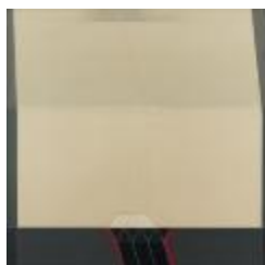
No identificado (CO_0031_1981)