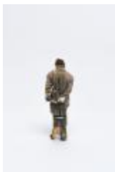
Figura a escala (CO_0019_1974)