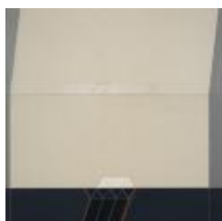
No identificado (CO_0015_1981)