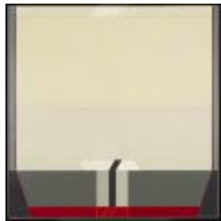
No identificado (CO_0044_1982)