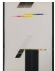
No identificado (CO_0065_1984)