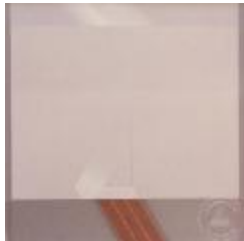
Vista frontal de la obra Space 8 (6-10031)