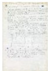
Taller de composición 1985. Desarrollo real (3-30007)