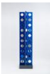
Espigas de fierro al viento (CO_0029_1970)