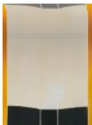
No identificado (CO_0057_1984)