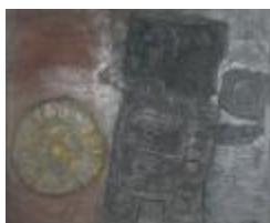
No identificado (CO_0111)