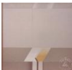
Vista frontal de la Serie Space 26 (6-10029)