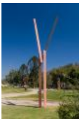
Aire – Luz (CO_0121_1989)