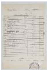
Acta de calificaciones finales de semestre (3-10018)