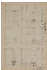
Croquis de pintura 3 (4-30004)