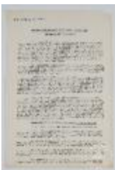
Algunas observaciones sobre arte y percepción visual de Rudolf Arnheim (3-20004)