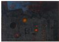
No identificado (CO_0032_1963)