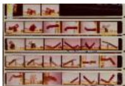
Vistas de maquetas de prismas triangulares (6-10034)