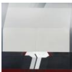
No identificado (CO_0108)