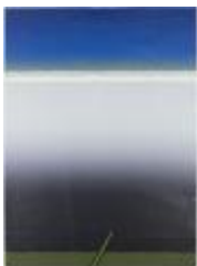
No identificado (CO_0051_1980)