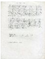
Memoria explicativa (6-20003)