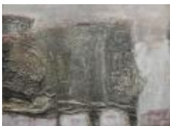
Petrificación I (CO_0144_1960)