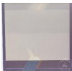
Vista frontal de obra pictórica de las serie Space (6-10026)