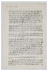
Transcripción o traducción de parte del libro El arte del color de Johannes Itten (3-20001)