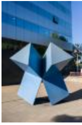
No identificado (CO_0122_1986)