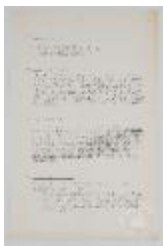
Taller de volumen. Programa (3-10007)