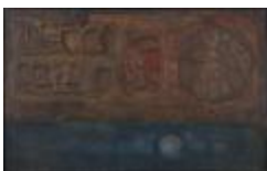
Huentelauquen II (CO_0104_1962)