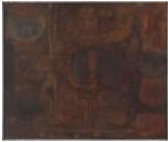
Personaje del Choapa III (CO_0099_1962)