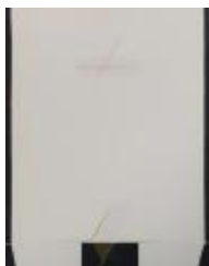
No identificado (CO_0061_1984)