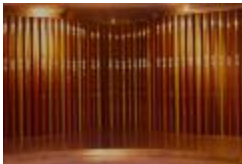
Santiago Centro Building Sculpture (CO_0128_1981)