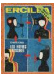
Revista Ercilla (5-20008)