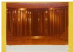
Vista frontal de la escultura "Santiago Centro Building Sculpture" (6-10017)