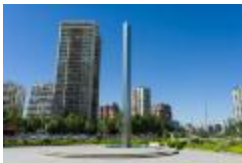
Monumento al General René Schneider (CO_0117_1971)