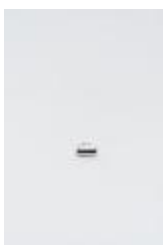
Anillo cilíndrico (CO_0021_1975)