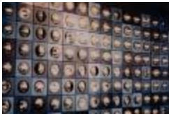
Kinetic Mural Bank of Concepción (CO_0125_1969)