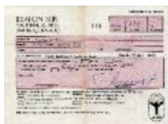
Comprobante del artista (6-30002)