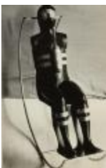
Hombre en el balancín (CO_0133_1967)