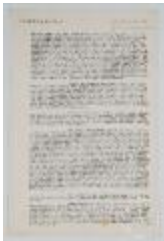
Transcripción o traducción de partes del libro El arte del Color de Johannes Itten (3-20002)