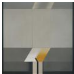
Space 26 (CO_0013_1982)