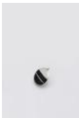
Colgante circular (CO_0025_1975)