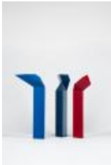
No identificado (CO_0094_1983 –1984)