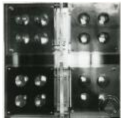
Vista frontal de escultura lentes de acrílico mas placas de colores (6-10007)