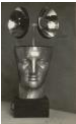
Sr. B (CO_0129_1966)