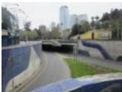
Mural Paso bajo nivel Santa Lucía (CO_0118_1970)