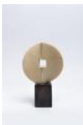
No identificado (CO_0028_1978)