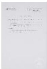
Tema final común (3-10023)