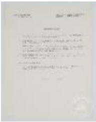
Taller de composición. Ejercicio nº 6 (3-10015)