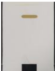
No identificado (CO_0064_1984)