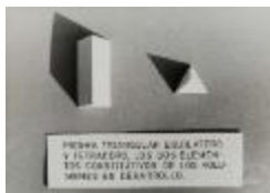
Vista cenital de maqueta de prismas triangulares (6-10035)