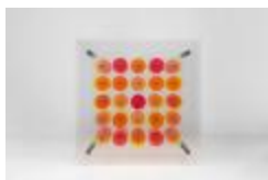
No identificado (CO_0038)