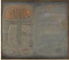
Chalinga - Mool (CO_0100_1961)