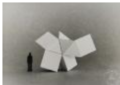
Vista maqueta en base a prisma triangular (6-10039)