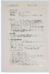
Taller de composición. Escuela de Arquitectura. Universidad Central. 1985 (3-10013)