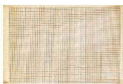
Hoja papel milimetrado (1-10013)