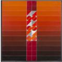
Pintura n° 9 A (CO_0047_1977)