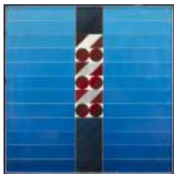
Pintura N° 4 (CO_0052_1976)