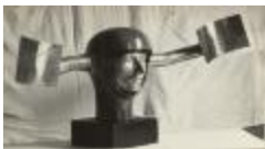
Súper Tessa (CO_0130_1966)