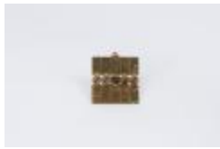
Colgante de bronce (CO_0092_1975 –1979)