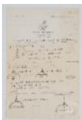
Lighting adresses & ideas (4-10001)