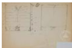
Croquis de pintura 5 (4-30006)