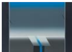
No identificado (CO_0078_1986)