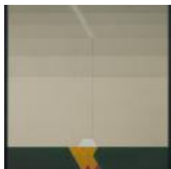
No identificado (CO_0014_1982)