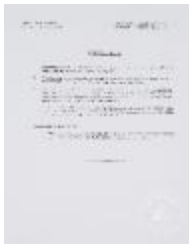
Taller de composición. Ejercicio nº 6 (3-10025)