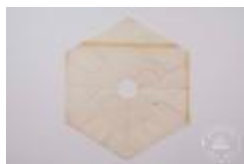
Molde hexagonal de papel mantequilla (4-10007)