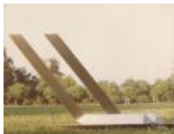
Vista frontal obra "Paralelas" (6-10019)