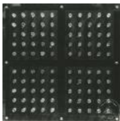
Vista frontal de escultura acrílico con prismas de color (6-10006)