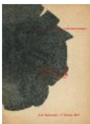
Tercera Bienal de escultura (5-20007)