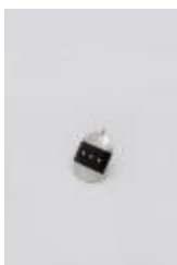
Colgante ovalado con tres puntos (CO_0023_1975)