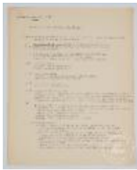
Programa forma y color 1 año básico (3-10003)