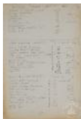
Detalles de diseño de lámparas (4-20001)