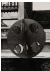
Vista Frontal de la escultura El Cuarto Mundo (6-10011)