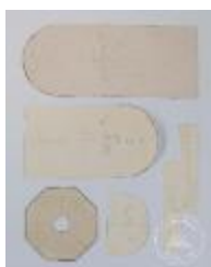
Molde preparatorio 1 (4-10008)