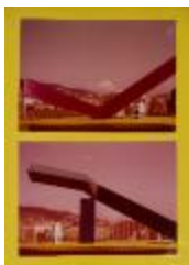
Set de fotografías frontales de maquetas escultóricas de prismas (6-10033)