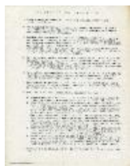
Declaración de principios (2-10010)