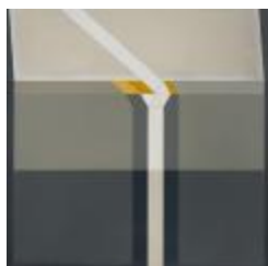
Space 11 (CO_0017_1981)