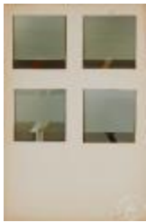
Vista frontal de obras pictóricas de la serie Space (6-10044)