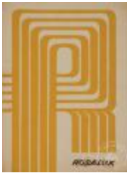
Catálogo Rosalux. Iluminación (4-20005)