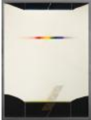
No identificado (CO_0007_1984)