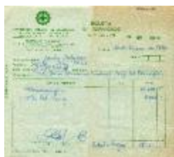
Boleta de servicios (6-30004)