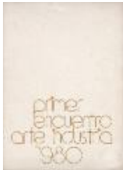
Primer Encuentro Arte-Industria 1980 (5-20011)