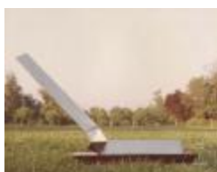
Vista frontal obra "Prismas" (6-10020)