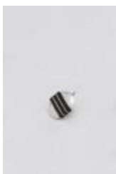
Colgante ovalado con dos líneas (CO_0022_1975)