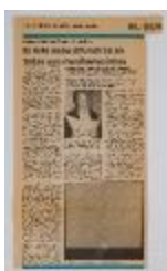
El Arte debe difundirse en todas sus manifestaciones (5-10006)