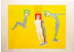
Tres humanonautas (CO_0008_1967)