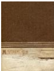
Cuaderno de croquis (4-30001)