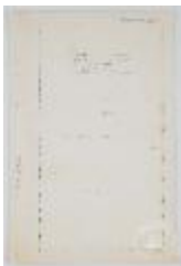
Planes y programas. Carrera: Arquitectura (3-10022)