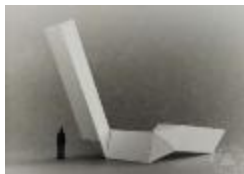
Vista de maqueta de escultura en base a prima triangular (6-10038)