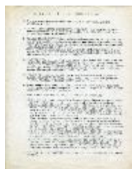
Declaración de principios (2-10009)