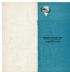
Premio Acero del Pacífico (5-20002)