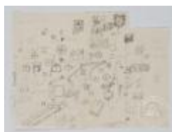
Dibujos geométricos y rayados sobre papel (4-10002)