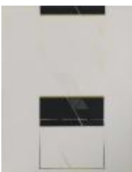
No identificado (CO_0067_1984)