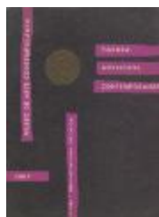
Pintura Americana Contemporánea (5-20003)