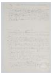
Taller forma y color. Curso preparatorio (3-10011)