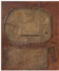
Tulahuen II (CO_0113_1962)