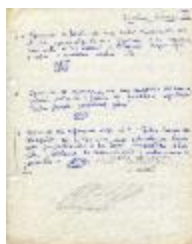
Diseño básico III y IV. Composición y expresión plástica. (3-30009)