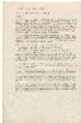
Instituto de Artes Visuales de Santiago. Programa (3-10001)