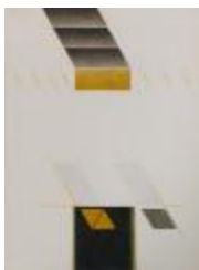
No identificado (CO_0063_1984)