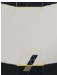
No identificado (CO_0069_1984)