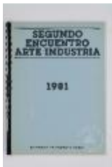
Segundo encuentro arte/industria 1981 (5-20013)