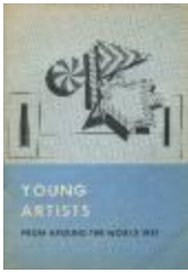
Young artists from around the world 1971 (5-20009)