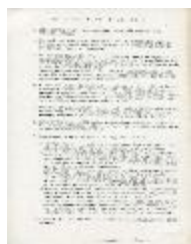
Declaración de principios (2-10011)