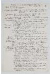
Taller de composición. Borrador de programa flexible adaptable al estudiante (3-10020)