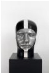
Sr. E (CO_0034_1966)