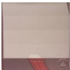
Vista frontal obra planimétrica (6-10022)