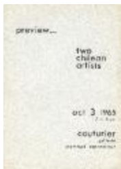
preview... two chilean artist (5-20004)