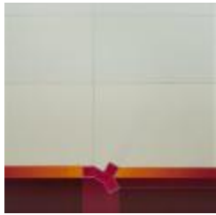
Sin título (CO_0041_1979)