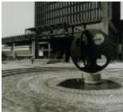
El Cuarto Mundo (CO_0119_1972)