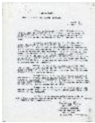
El paisaje. Obras recientes de Carlos Ortúzar (2-10012)