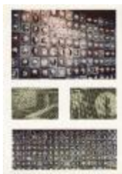
Vistas del mural del Banco de Concepción (6-10010)