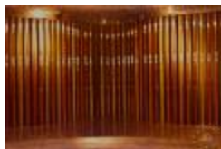
Vista frontal de la escultura "Santiago Centro Building Sculpture" (Primer plano) (6-10018)