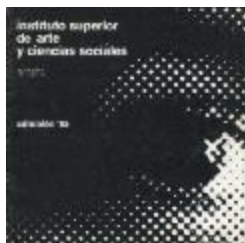
Carreras del Instituto superior de arte y ciencias sociales. Arcis. 1985 (3-10008)