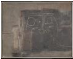
Visión del norte chico (CO_0050_1960)