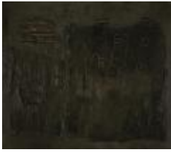
Chalinga II (CO_0146_1961)