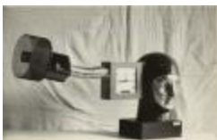
Sr. D y la memoria lateral (CO_0131_1966)