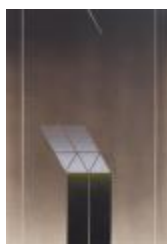
No identificado (CO_0005_1985)