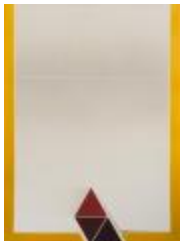
No identificado (CO_0059_1984)