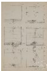
Croquis pinturas 2 (4-30003)