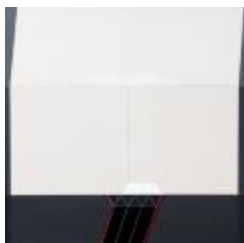
No identificado (CO_0107)