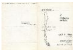
preview... 7 chilean artist (5-20005)