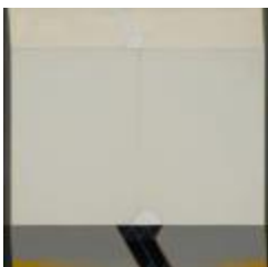
No identificado (CO_0105_1982)