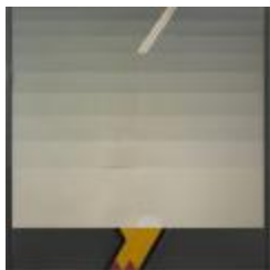
No identificado (CO_0098_1983)