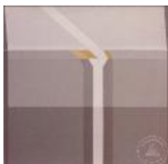
Vista frontal de la obra Space 11 (6-10027)