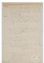
Programa forma color I básico 1973 (3-10006)