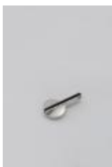
Colgante compuesto (CO_0024_1975)