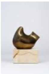
No identificado (CO_0091_1978)