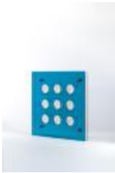
No identificado (CO_0089_1970)