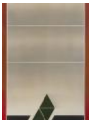
No identificado (CO_0060_1984)