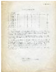
List of photographies (6-20001)