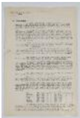
Transcripción o traducción de partes del libro el Arte del Color de Johannes Itten (3-20003)