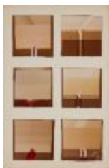
Vista frontal de obras pictóricas de la Serie Space (6-10040)