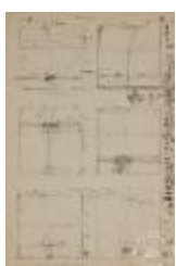
Croquis de pintura 4 (4-30005)