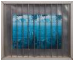
No identificado (CO_0010_1982-1983)