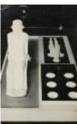
Hombre en la plataforma (CO_0134_1967)