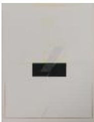
No identificado (CO_0068_1984)