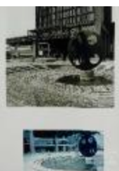
Vistas en 3/4 de la escultura El Cuarto Mundo (6-10012)