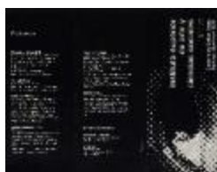
Instituto superior de arte y ciencias sociales. Carrera de Bellas Artes. Talleres Electivos (3-10009)