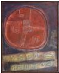
Tulahuen I (CO_0148_1961)