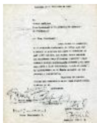
Carta a Germán Domínguez (1-10005)