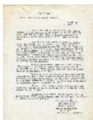
El paisaje. Obras recientes de Carlos Ortúzar (2-10008)