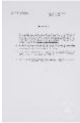
Taller de composición. Ejercicio nº 7 (3-10026)