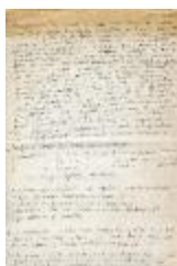
Descripción escultura cuatro primas (titulo tentativo) (6-20006)