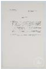
Taller de composición. Ejercicio nº 7 (3-10016)