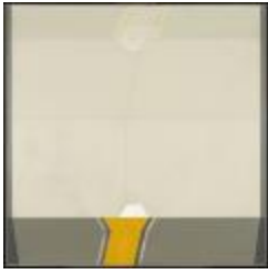
No identificado (CO_0046_1983)