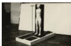
Hombre y mujer (CO_0135_1967)