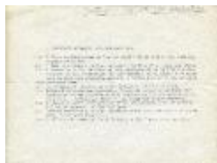
Cintac. Multiple. Sculpture. Material necesario para una escultura (6-20004)