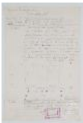
Taller composición. Desarrollo real (3-10021)