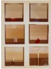
Vista frontal de obras pictóricas de la serie Space (6-10045)