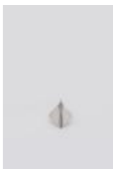
Colgante rombo (CO_0026_1975)