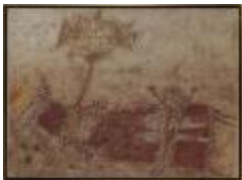
Trauco portado de la maquina de los sueños (CO_0141_1964)