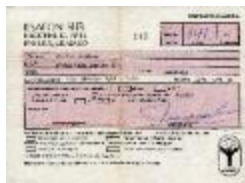
Comprobante del artista (6-30003)