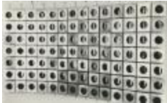
Mural Varig (CO_0124_1968)