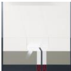
No identificado (CO_0106_1981)