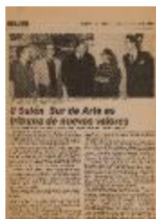
II Salón Sur de Arte es tribuna de nuevos valores (5-10007)