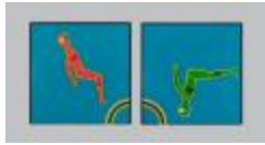
Dos humanonautas (CO_0039)