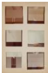
Vista frontal de obras pictóricas de la serie Space (6-10043)