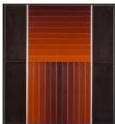
Pintura N° 4 (CO_0053_1976)