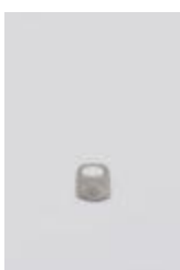
Colgante de plata (CO_0027_1975)