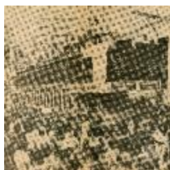
Caderneta de poupança. Recorte de prensa (1-10011)